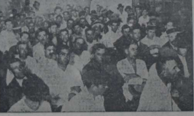
VISTA DE UNA PARTE DE LA ASAMBLEA