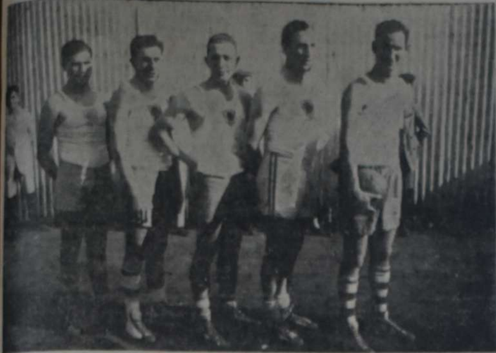
COMPONENTES DEL EQUIPO SPORTIVO BARRACAS (SEGUNDA DIVISION) QUE FUE DERROTADO POR Independiente

NOTAS GRAFICAS DEL PARTIDO JUGADO EL DOMINGO ULTIMO EN EL CAMPO DE DEPORTES DE SPORTIVO BARRACAS