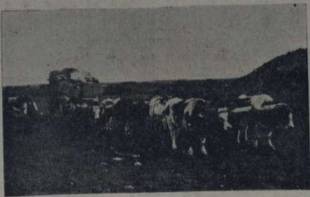
LA CARRETA, EXPRESION DE UNA EPOCA QUE TARDA EN desaparecer por el atraso de nuestra campaña, ocupa todavía el lugar del camión para los transportes.

"Digo, pues, a los pueblos todos de la República, que Chivilcoy es el programa del Presidente don Domingo Faustino Sarmiento, doctor en leyes de la Universidad