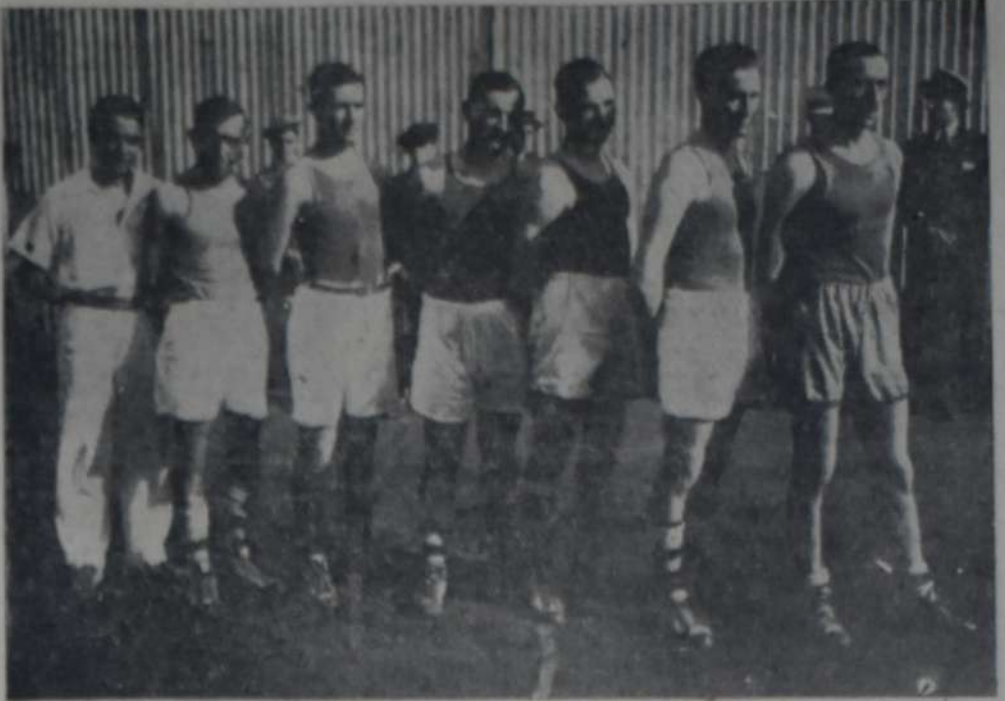
EQUIPO DEL CLUB INDEPENDIENTE QUE EN UNA BELLA EXHIBICION DE BASKETBOL, DERROTO a Sportivo Barracas por 38 tantos contra 30.